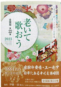
歌集「老いて歌おう2023」

また、この大会に応募された方全員の作品(一人一首)を掲載した短歌集「老いて歌おう2023」(鉦脈社出版)が刊行されています。ぜひご覧ください。